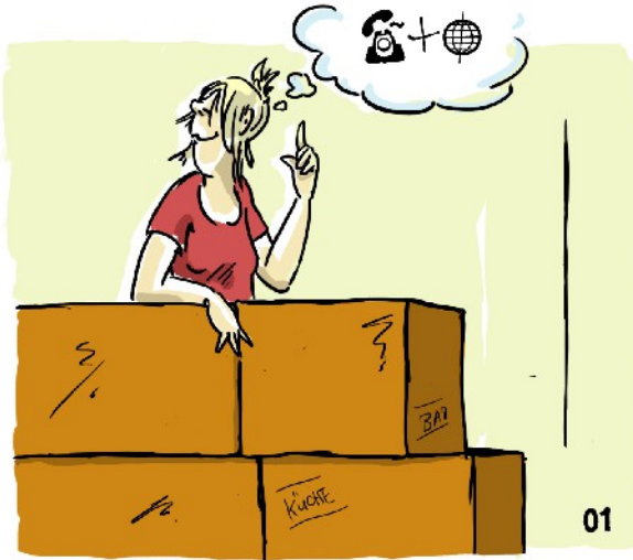
01 5. Mai, Umzug

von Steffi Oberheim (leidvolle Erfahrung)