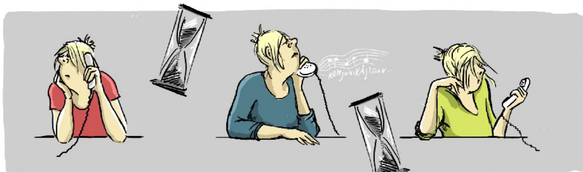
... 8 Wochen ...