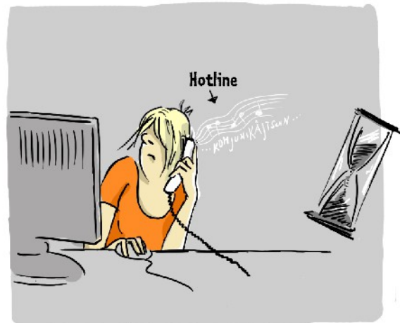
... 7 Wochen später